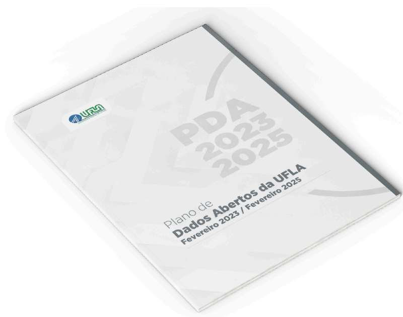
Figura 3: Página de Dados Abertos - PDA 2023-2025 UFLA

Diante disso, a Autoridade de Monitoramento da LAI entrou em contato com a reitoria, e com as equipes da Coordenadoria de Inteligência e Governança de Dados (CIGD), da Diretoria de Gestão de Tecnologia da Informação e da Superintendência de Governança da UFLA, solicitando a revisão e a atualização do Plano de Dados Abertos da instituição. Esse processo visa assegurar que o plano esteja alinhado com os princípios de transparência e governança estabelecidos pela legislação vigente.