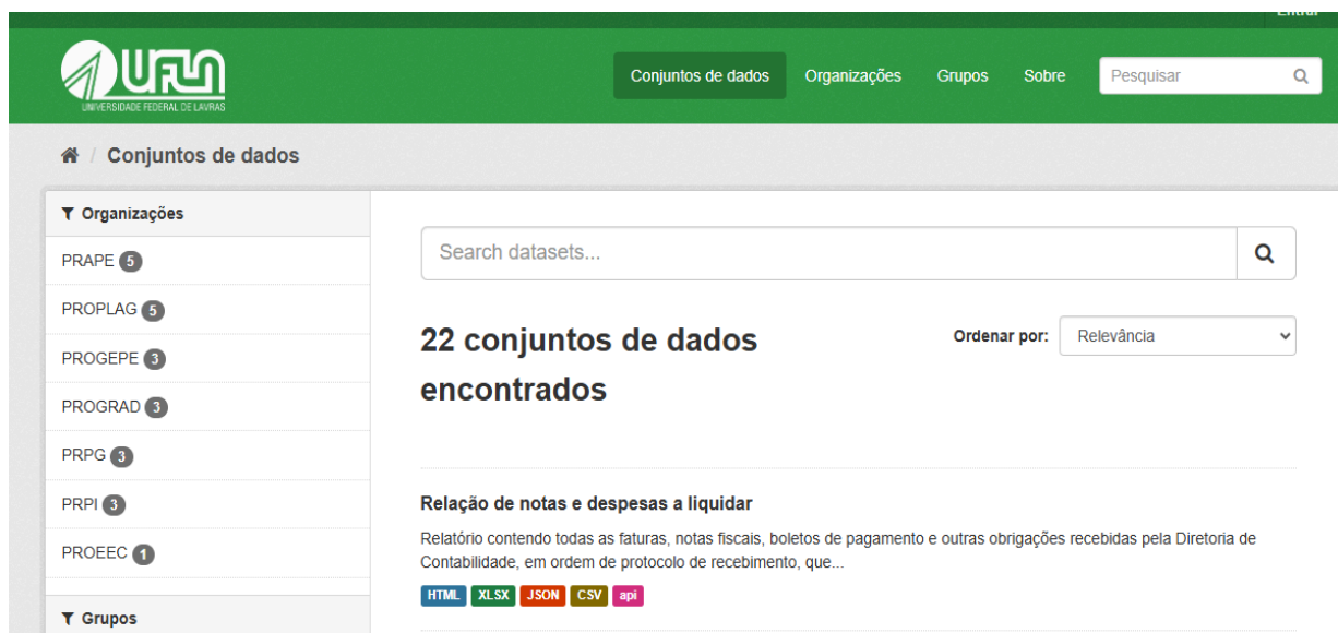
Figura 1: Portal Dados Abertos da UFLA: 22 conjuntos de dados disponíveis em 2024.