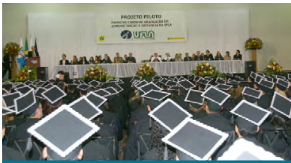
Nova modalidade de ensino exige perseverança

O Projeto Piloto representa um marco para a Universidade e serviu de incentivo para criação de cinco novos cursos à distância.